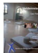
DVD 35 min. kostenlos

Sind grundsätzlich möglich. Uns ist wichtig, dass für niemanden die Teilnahme an finanziellen Gründen scheitert! Gruppengröße ist zwischen 6 und 18 Teilnehmern. Wenn Sie an Fort- und Ausbildungen in Gestalttherapie interessiert sind, schicken wir Ihnen gerne unsere Ausbildungsunterlagen zu.