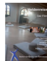
DVD 35 min. kostenlos

Gruppengröße ist zwischen 6 und 12 Teilnehmern.