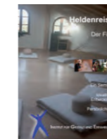
DVD 35 min. kostenlos

Gruppengröße ist zwischen 6 und 12 Teilnehmern.