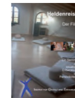
DVD 35 min. kostenlos

Gruppengröße ist zwischen 6 und 12 Teilnehmern.